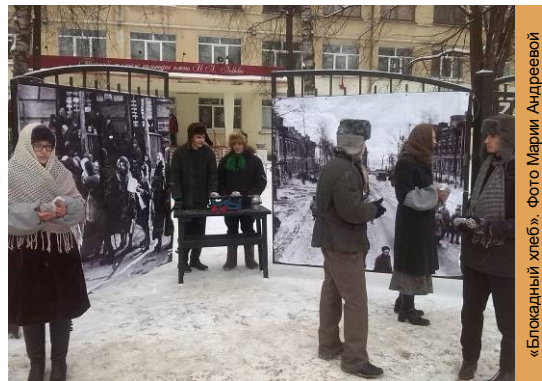
«Блокадный хлеб».